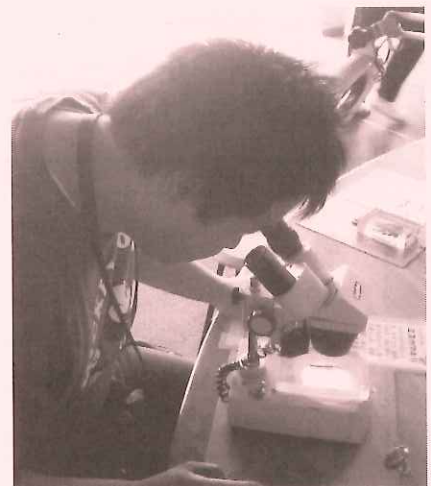
那珂川水遊園で興味深そうに水生昆虫の標本をのぞく利用者さん