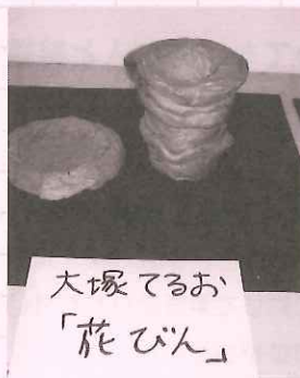
大塚輝夫さんの作品 「花びん」