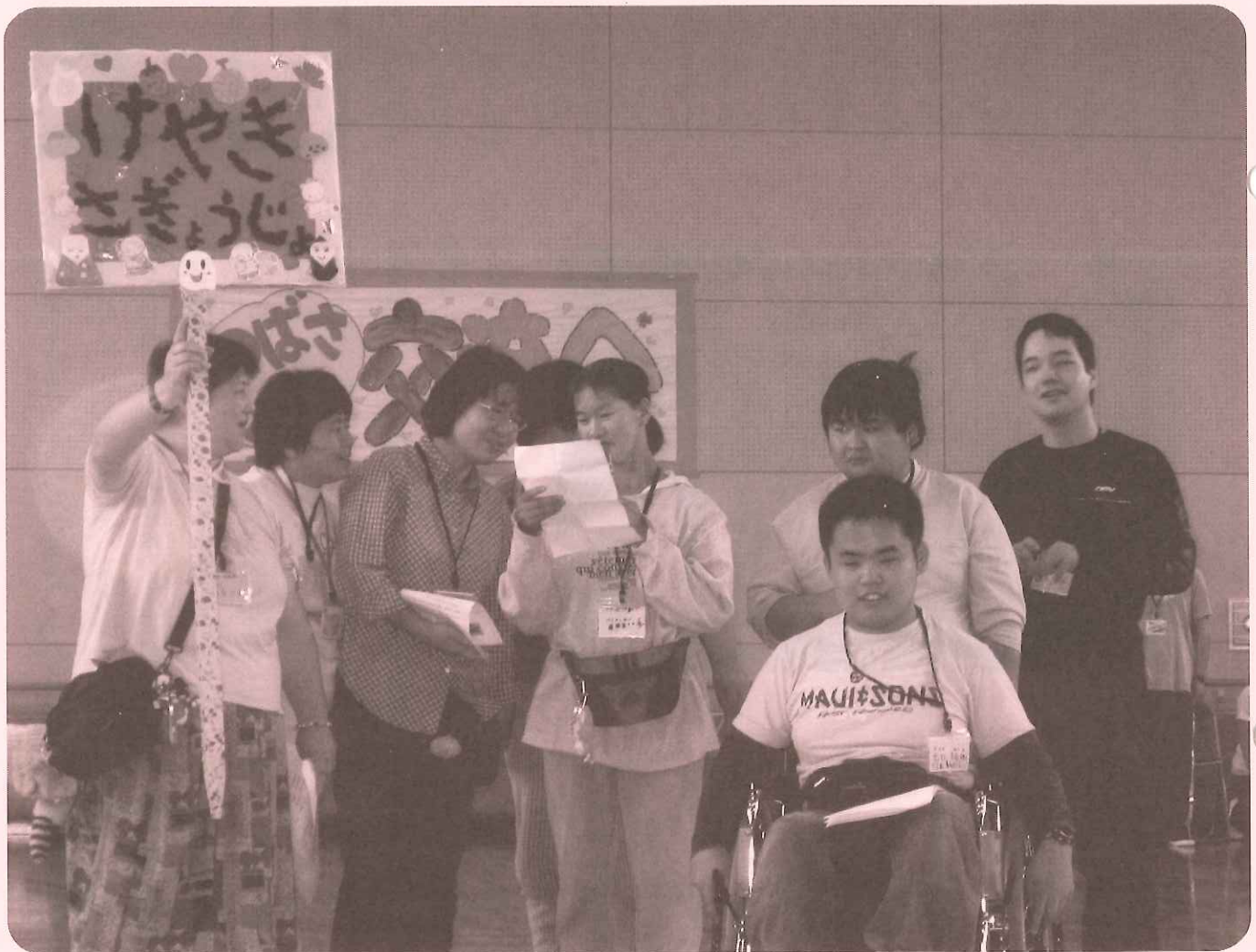
「交流会に参加したけやきの仲間たち」（けやき作業所）