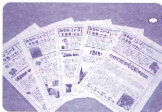
毎月発行・54号になりました

地域に毎月発行している「みらいニュース」。その中でアルミ缶の寄付のお願いをしたところ、地域の方からアルミ缶をいただくようになり、量も年々増えています。