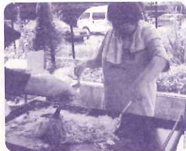
「焼きそば、焼けたよ〜!」

バーベキューも終わりにさしかかるところ「今日は楽しかった?」と仲間たちに聞くと、みんな満足した顔で「楽しかった!」の声があがり、これで盆休みも無事に過ごせそうなの?そんな暑気払いとなりました。