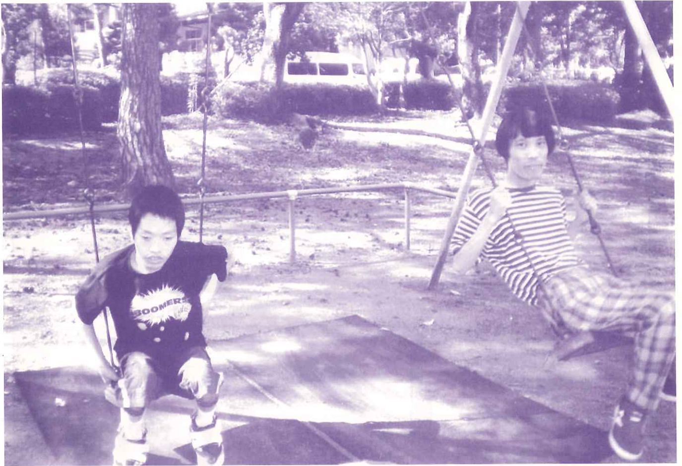
♪ブランコがゆれる～ぼくの夢のせて～♪（セルフ・みらい）