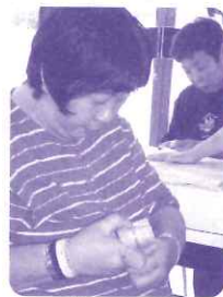
アクセサリーの袋詰めなど細かい作業もがんばります

食料や衣料、カレンダーなどの物資販売、毎度ご協力ありがとうございます。 その他臨時の急ぎの仕事もこなしています。