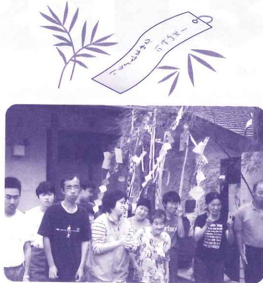
「みんなで、はいピース！」

行いました。空を見上げると残念ながらもりでしたが、「来年は晴れるといいね」「そうだね」といながら楽しい時間を過ごすことができました。