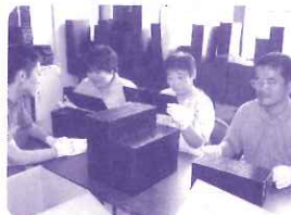
パソコンの部品を選別するトレイを再利用するための「トレイ選別」小さな数字を見間違えないように真剣です。