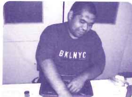
ベアリング(車の部品)の組み立てパチパチ音をはめています。