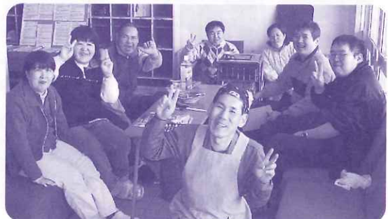
4月から第2に来る気満々のメンバーさん

そして、あらためて支援というもの、障害というものの、何より人間というもので成り立つ社会と向き合っていくことになるのではないだろうか・・・。