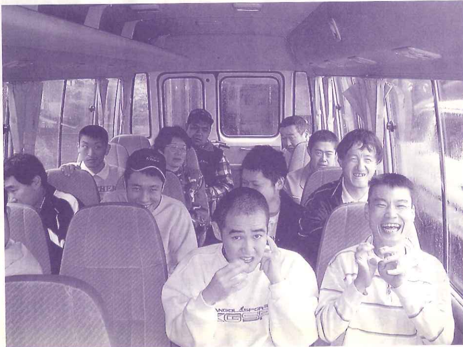
スポーツクラブだ！体育館にしゅっぱーつ☆ (こぶし作業所)