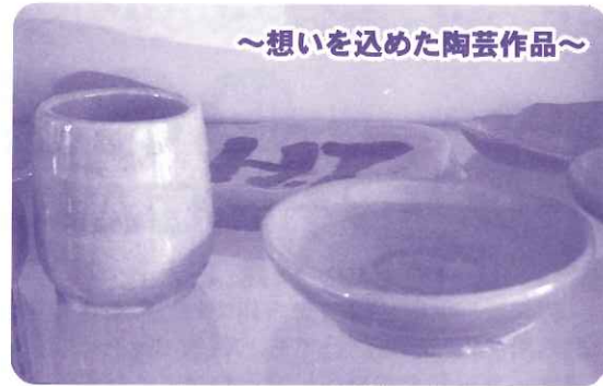
～想いを込めた陶芸作品～

症状を訴えていても、精神関係者でなければ中々症状とは認識しづらいため、彼らの不調は目に見えず、