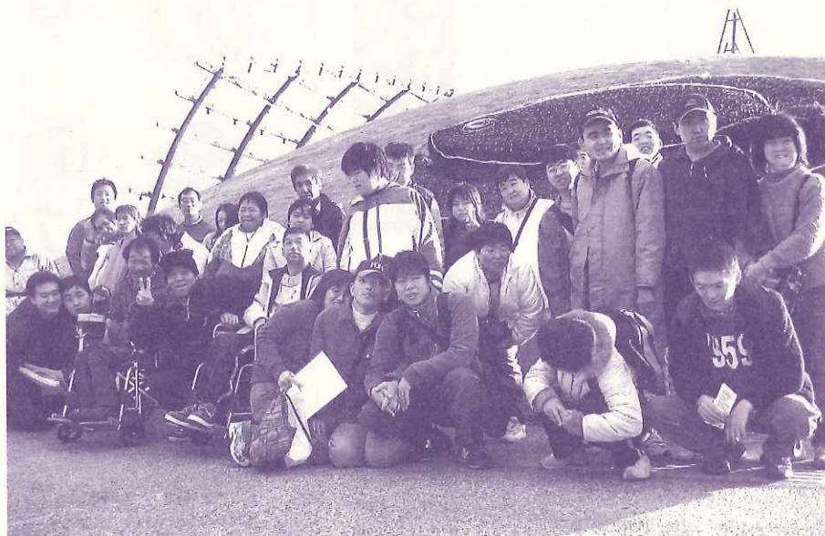
みんなでアクアマリン(^o^)/ (けやき作業所)